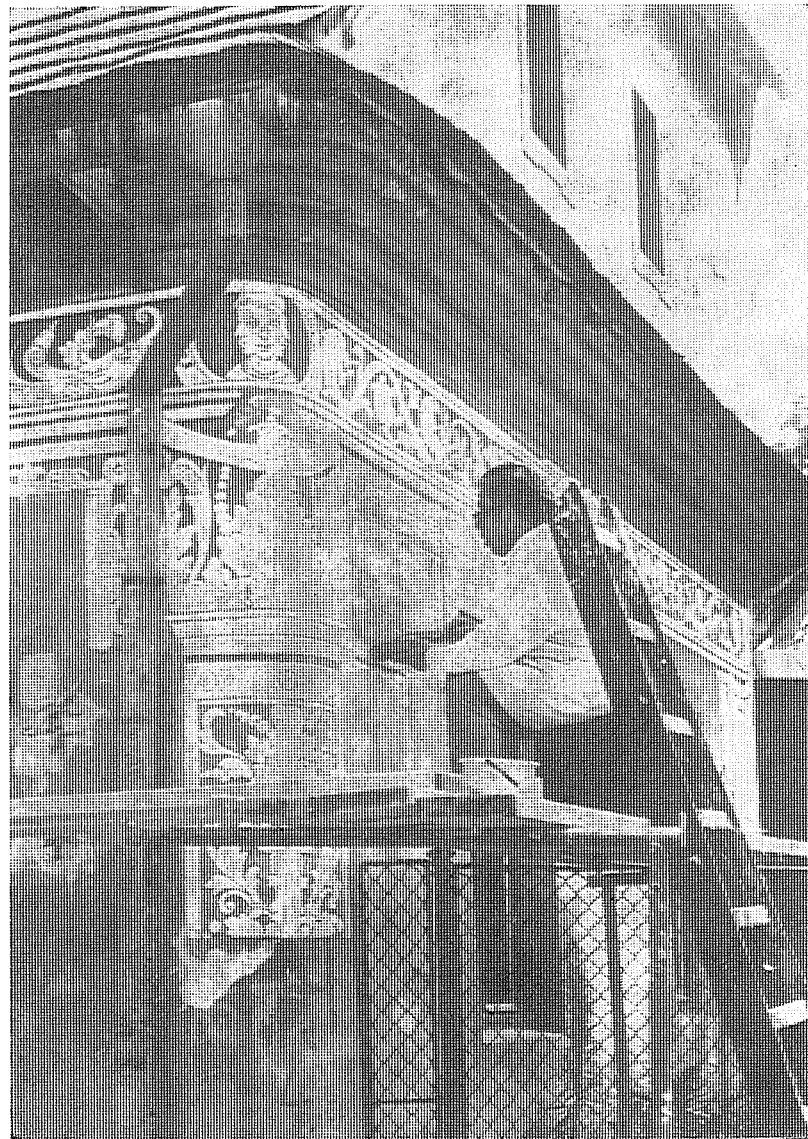
Rekonstrukce sgrafit na tzv. bratrské škole ve Hřbitovní ulici.