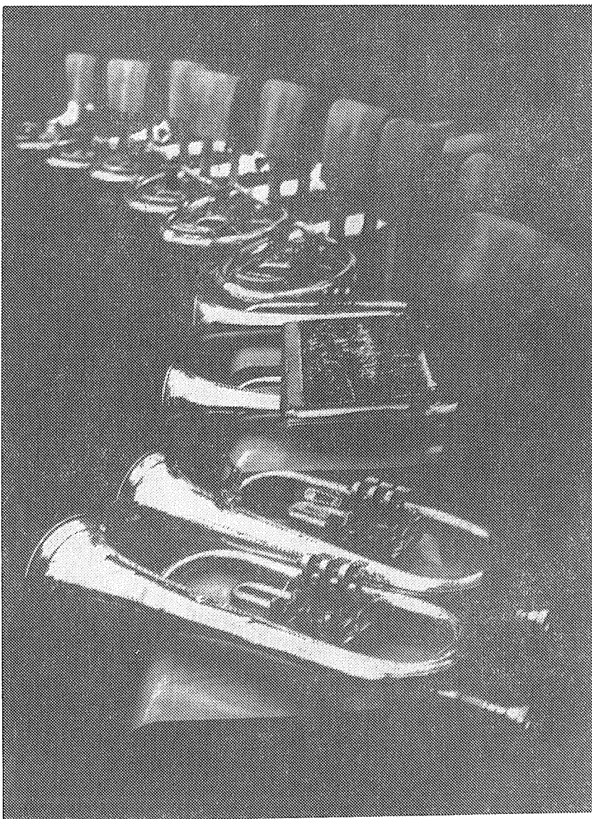
Gustav Giebl: Přestávka