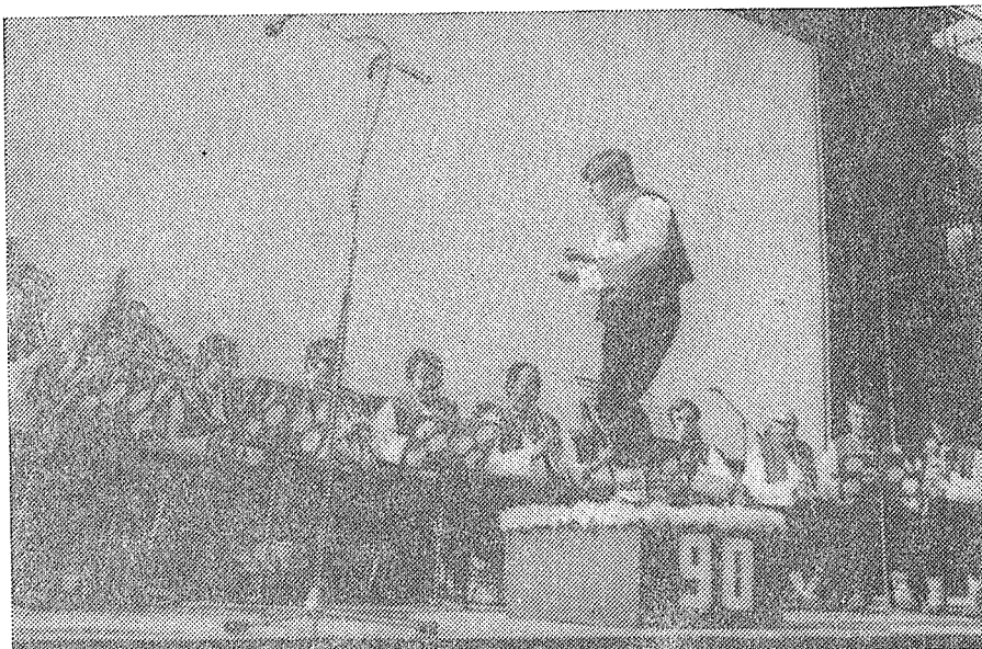
Dechový orchestr „Valaška“ Spojeného závodního klubu Valašské Klobouky — vítěz IV. ročníku festivalu dechových hudeb O ZLATOU TRUMPETU