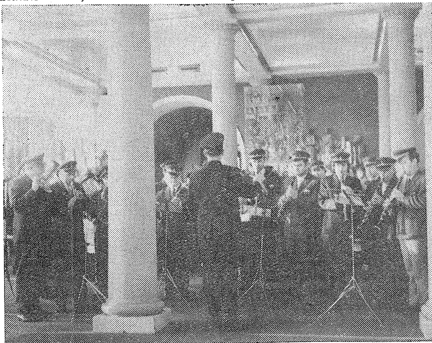
Dechový orchestr JKP Hranice při vystoupení na výstavě 50 let SSSR v Praze.

● V gotickém sále hranické radnice bude v době od 11. 2. do 28. 2. 1973 instalována výstava dokumentů a fotografií k výročí Vítězného února 1948. Výstava bude dokumentovat nejen události roku 1948, ale i budování socialismu v našich zemích. Vedle dokumentů celostátního významu bude věnována pozornost dokumentaci únorových událostí a budovacímu procesu v Hranicích.