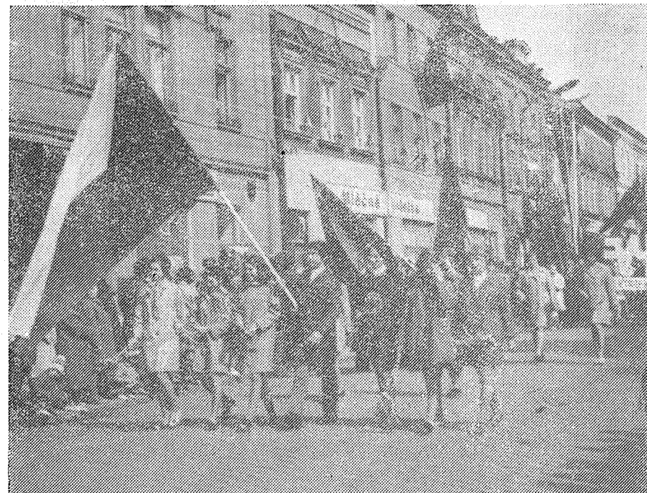
1. máj -- manifestace vítězného pochodu socialismu!