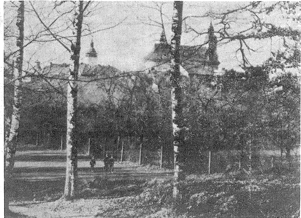
Fotografie dr. Jiřího Musioly