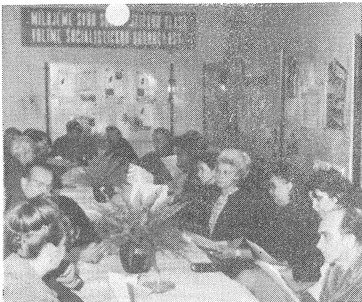
Záběr ze slavnostního otevření agitačního střediska.