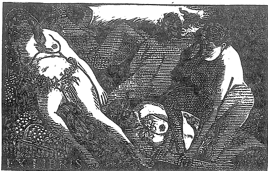
Ex libris „Hodokvas“ z cyklu „Vinařství“.

a grafici, vybrala také větší práci akad. malíře Lad. Vlodek pod názvem „Čtení o van Goghovi“, provedenou technikou linorytu. Lad. Vlodek se rovněž zúčastnil celostátní soutěže na umělecké dílo k 50. výročí založení KSČ, kterou vypsal Český fond výtvarných umění. Práce akad. malíře Lad. Vlodek pro tuto soutěž byly odměněny peněžitou cenou. Také v letošním roce Lad. Vlodek uskutečňuje několik významných uměleckých záměrů. LN