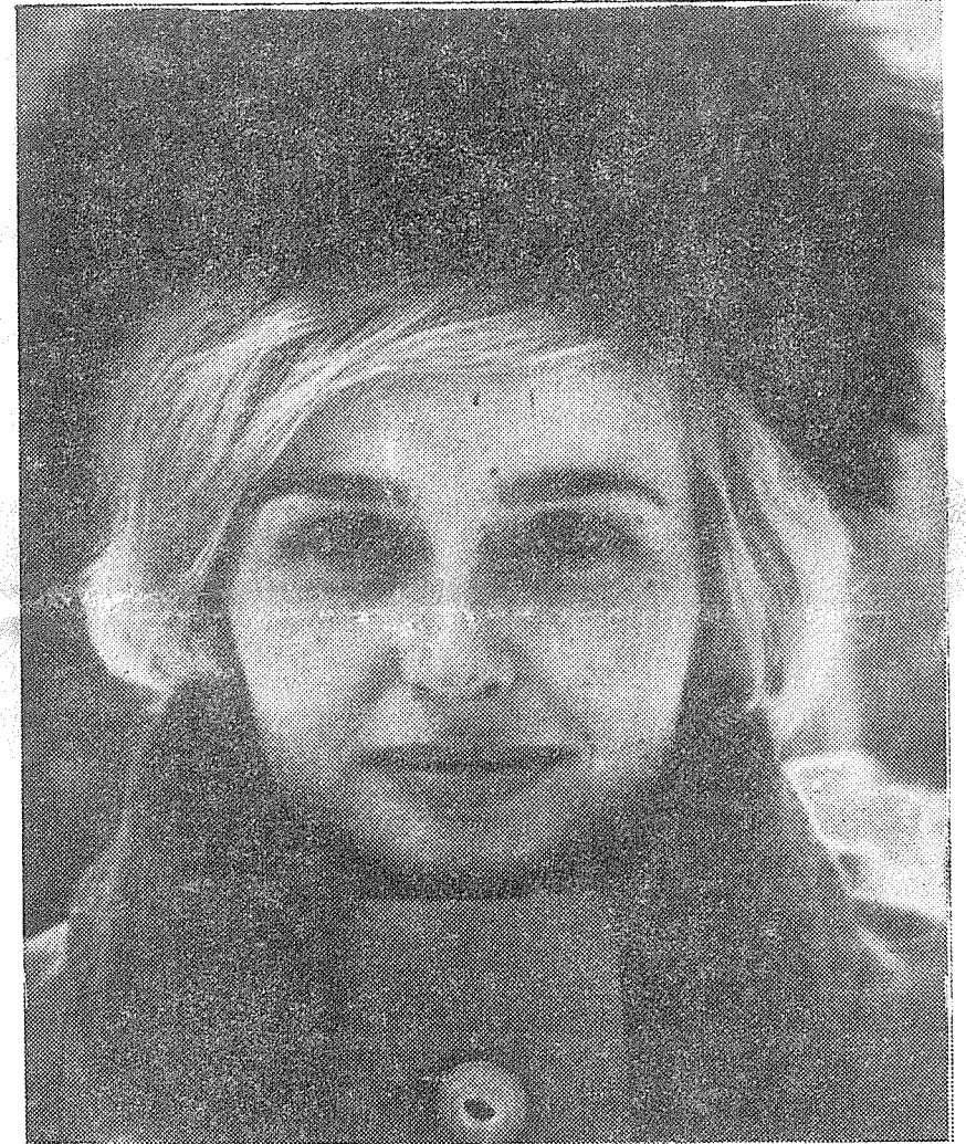
Josef Černý: Portrét