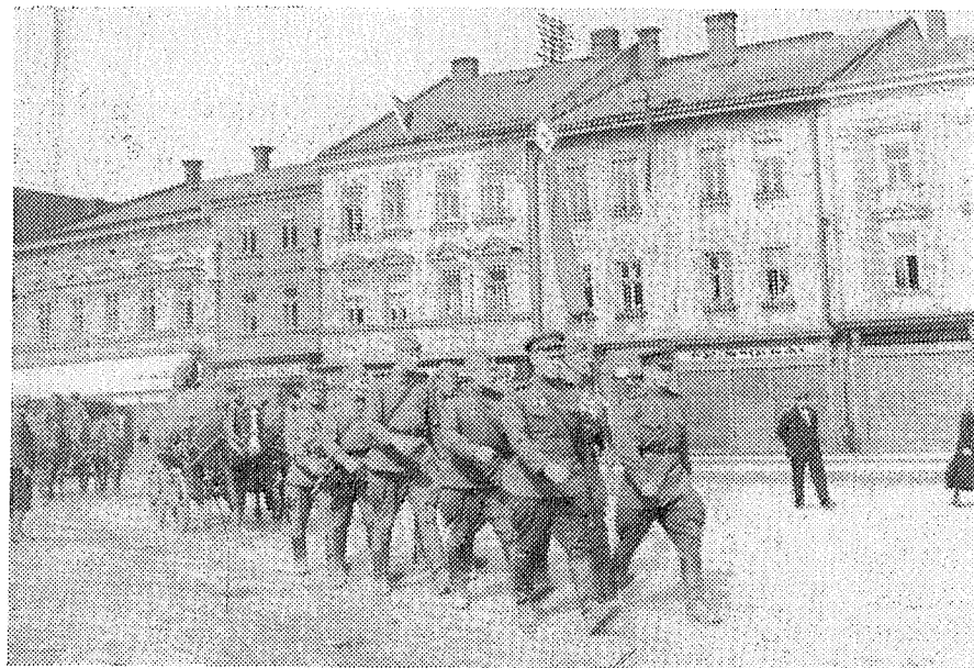
Snímek z květnových dnů osvobození v našem městě v roce 1945.

A nápisy na rudých hrobech v zahrádkách při silnicích a náměstích, to bude první abeceda, které budu učit své syny.