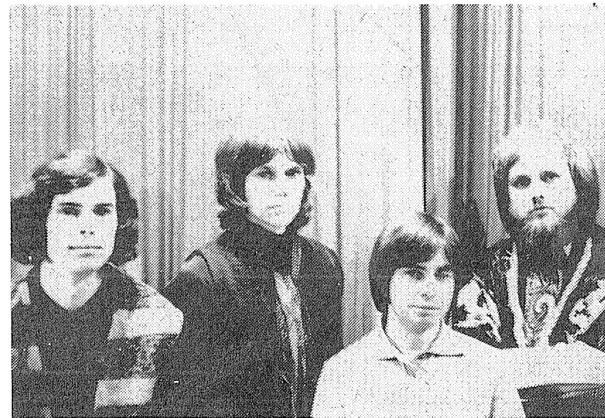
Populární pražská beatová skupina THE CARDINALS, jejíž koncert se bude konat v Hranicích dne 24. května v 19.30 hodin v sále JKP.

Výstava je instalována v gotickém sále hranické radnice. Je přístupna denně od 1. do 15. května 1970. MJ