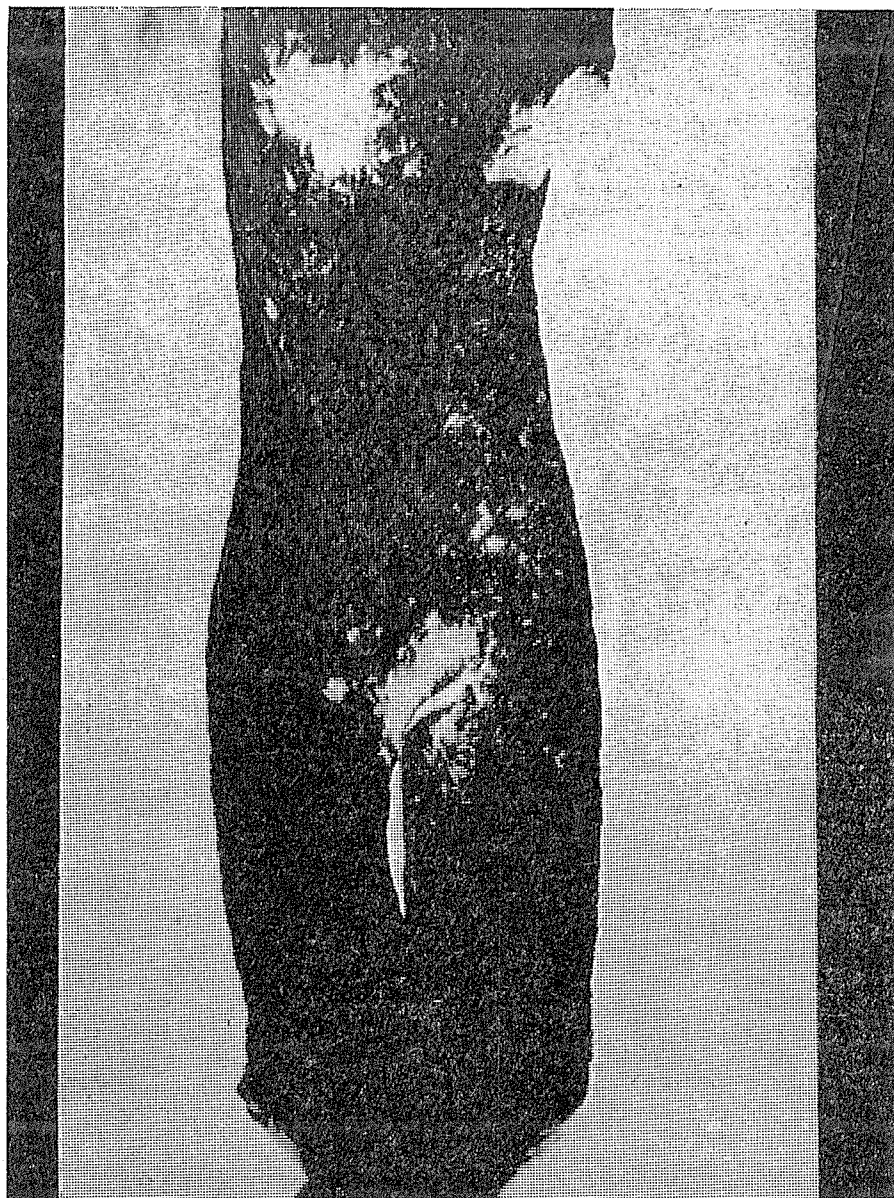
TORZO - Fotografie Josefa Černého