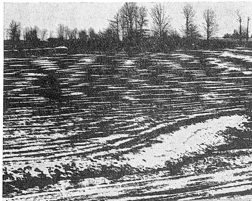
Fotografie ing. Milana Sanatřika

A tak mu přejeme hodně zdraví a duševní svěžesti, aby se mohl všem svým zálibám stále plně věnovat!