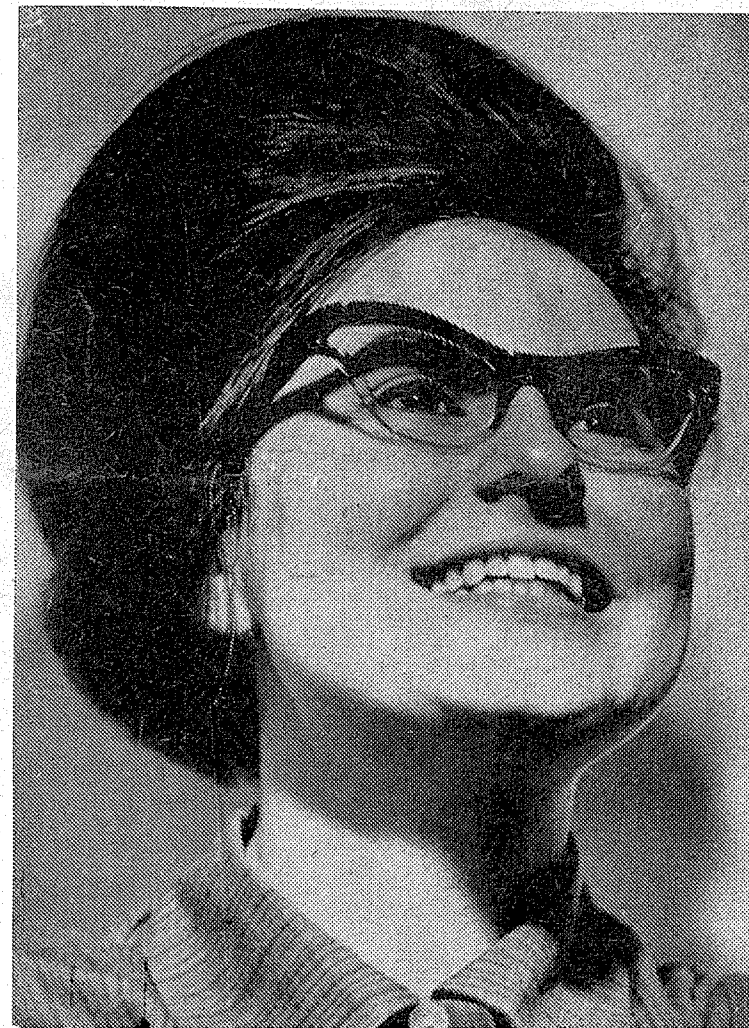
ÚSMĚV - fotografie Josefa Černého