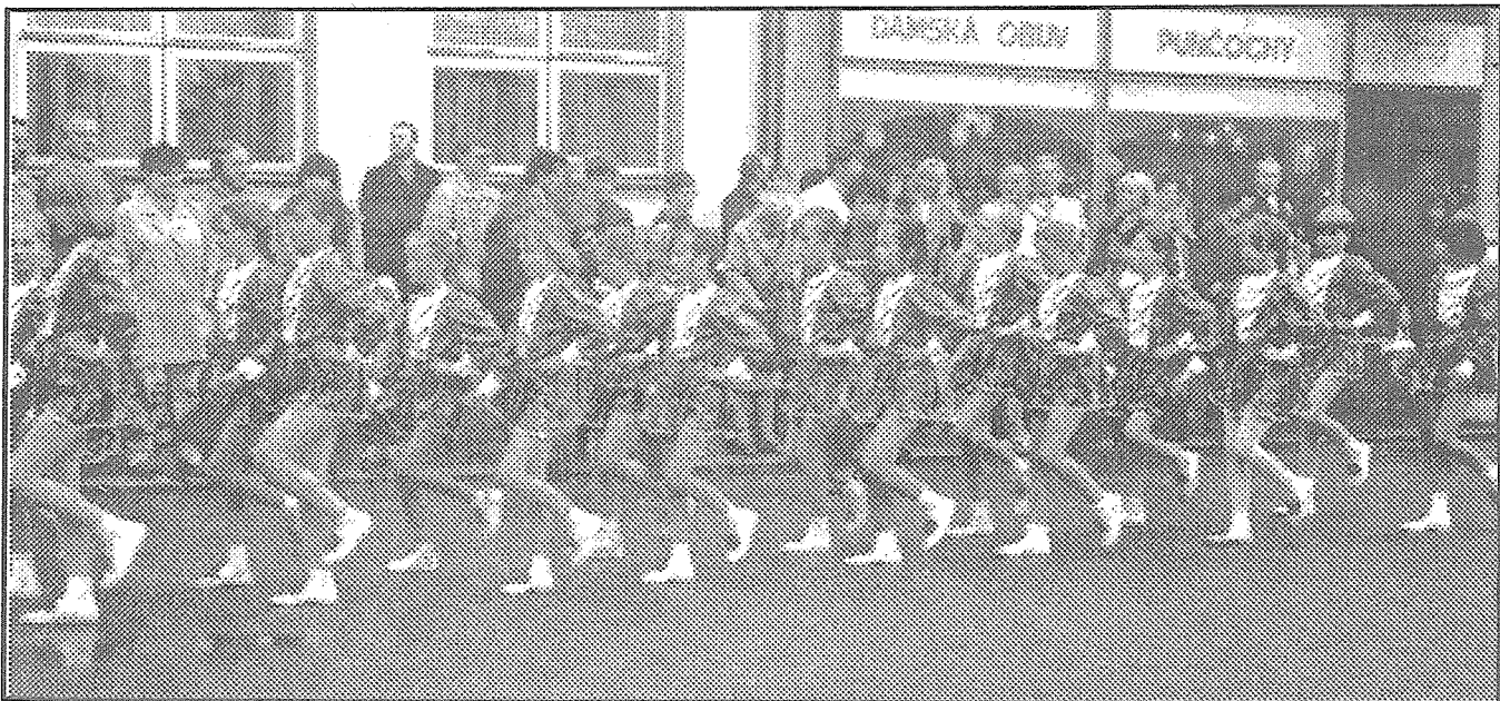
Poprvé se občanům představily hranické mažoretky ze Základní školy Nová ul. Přestože ještě nestačily nacvičit celý soutěžní program, zúčastnily se mimo soutěž pochodového defilé. A vedly si v něm dobře.

ze slavnostního zahájení přehlídky na Masarykově náměstí.