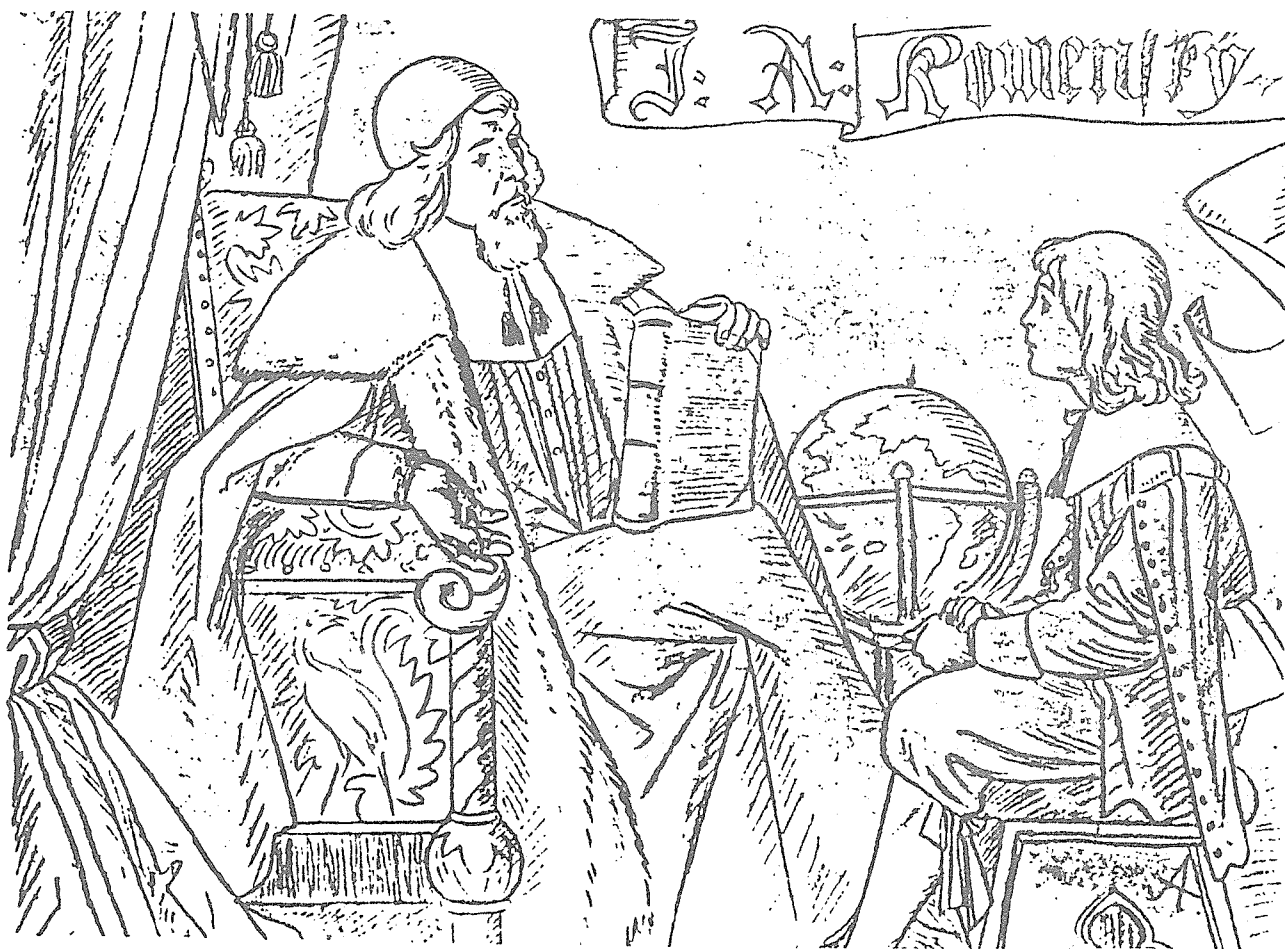
Mikoláš Aleš: J.A. Komenský a žák. (1898)