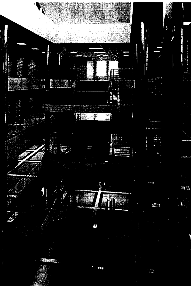
Ivan Bergmann, Vysoká škola v Hradci Králové – interiér, realizace 1995–1997

bez siláckých gest a nahodilostí vlastní výtvarný názor po logické vývojové trajektorii. Schopnost inspirovat se prostředím bez eklekticismu a být upřímným k sobě a k ostatním. Předpokladem pro takto konzistentní a zásadový postoj je autorova vnitřní disciplína, jejíž kořeny vycházejí nepochybně z tradice zlínského funkcionalismu.