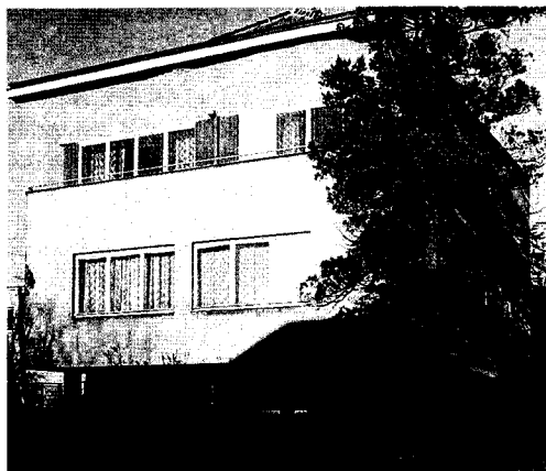
Karel Caivas, Tomancova vila v Hranicích na Moravě, 1938