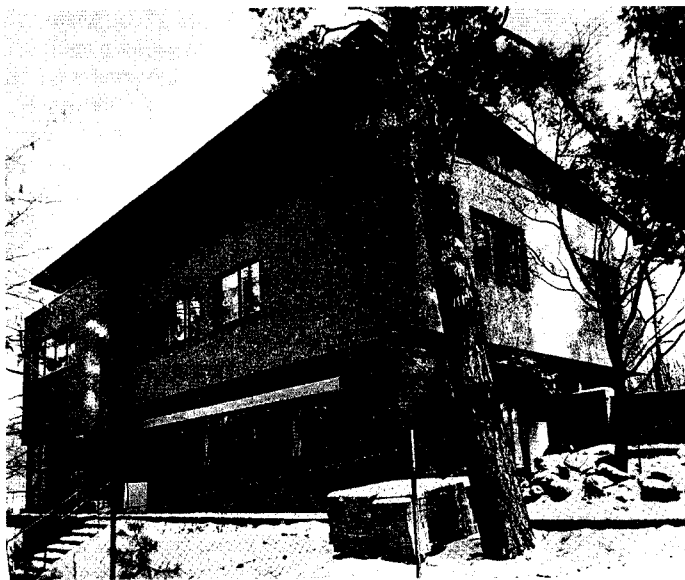
Karel Caivas, Polednova vila v Teplicích nad Bečvou, 1939–1940

Dvoupatrový objekt s valbovou střechou je působivý především díky prvnímu patru, jenž je z poloviny na kamenné podezdívce a z druhé části volně nad zemí podepřen třemi válcovými pilíři. Díky kontrastu subtilního přízemí, masivního prvního patra