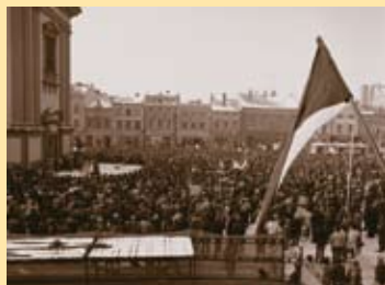
Generální stávka, 27. listopadu 1989.