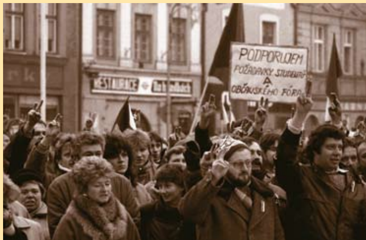
Shromáždění v době generální stávký, 27. listopadu 1989. ■ Foto: Roman Kubíček

ÚVOD Surové rozehnutí demonstrace, k níž došlo v pátek 17. listopadu 1989 na Národní třídě, odstartovalo pád socialistického totalitního režimu v tehdejší Československu. Vývoj ve větších i menších městech v hlavních obrysech kopíroval postup událostí, k nimž docházelo v Praze, vždyt také legitimita místních Občanských fór vyplývala z legitimacy pražského OF. V detailech byl však místní vývoj pokaždé jiný. ■ Tento text má být stručným ohlédnutím za prvním rokem společenské proměny v Hranicích. Příběh začíná listopadem 1989 a končí o rok později svobodnými komunálními volbami, prvními po čtyřech desetiletích manifestačních voleb, které nabízely jedinou volební kandidátku.