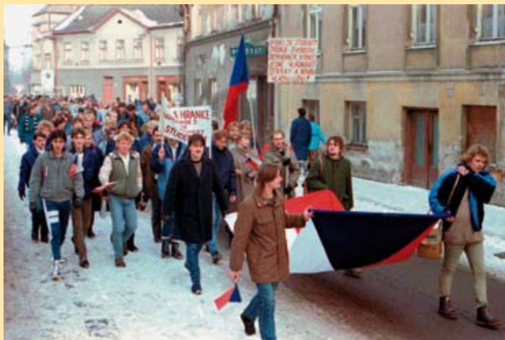
Zaměstnanci Sigmy Hranice směřují Jiráskovou ulicí na shromáždění u příležitosti generální stávkou, 27. listopadu 1989.