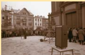
Generální stávka na náměstí, 27. listopadu 1989.