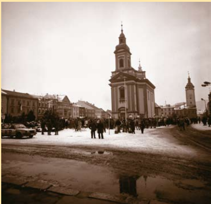
Generální stávka, 27. listopadu 1989.