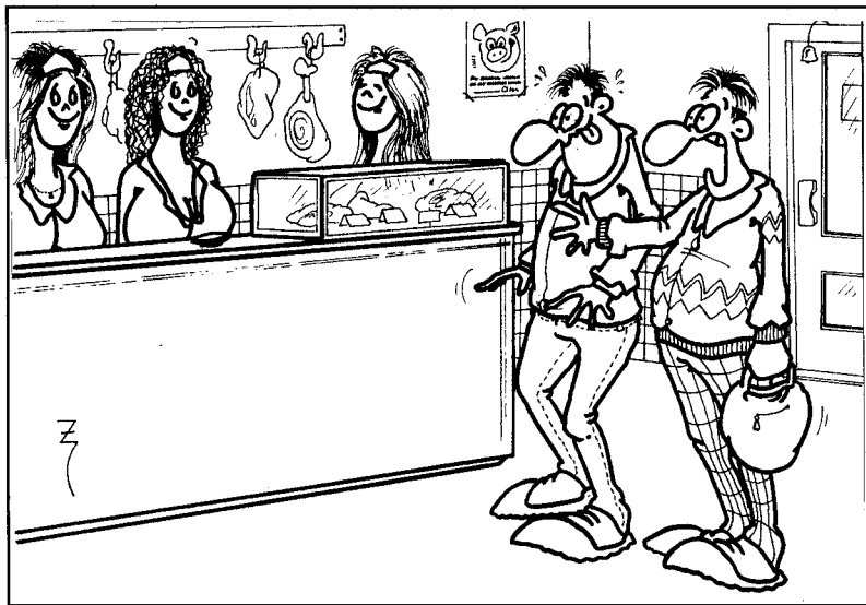
Sakryš, co je to za řeznictví, vždyť tu jsou jen samé kosti! Kreslí Igor Zajíček