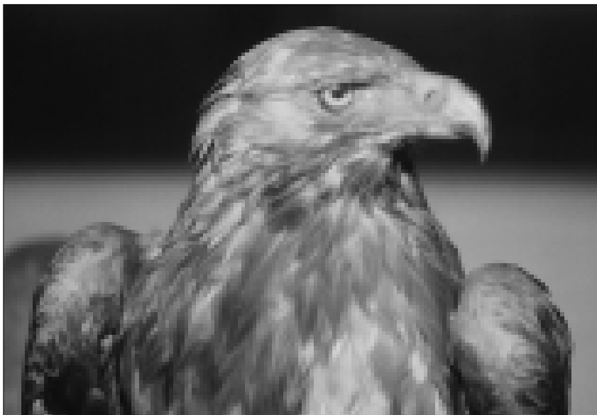
Obr. 1. Orel skalní ( Aquila chrysaetos ), Liechtenstein, srpen 1890, dar vládnoucího knížete Jana II. z Lichtenštejna, sbírka Střední lesnické školy v Hranicích.

Dva kusy přírodnin tam daroval vládnoucí kníže Jan II. z Lichtenštejna (Johann II. von und zu Liechtenstein, * 5. 10. 1840, zámek Lednice – † 11. 2. 1929, zámek Valtice, v 89 letech), vladař domu Lichtenštejnů, kníže opavský a krnovský, hrabě z Rietbergu. Mecenáš věd a milovník umění a zakladatel Lovecko-lesnického muzea v Úsově na Moravě (Hanák et al. 2004), obdaroval sovinecký ústav v 2. kvartálu školního roku 1888/89 jed-