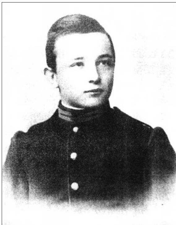
Robert Musil v uniformě chovance Vyšší vojenské reálky v Hranicích, Vánoce 1893.

je všechno trvalé a že stát je nejlepší zárukou stálosti. Práva občanů byla zakotvena v zákonech a parlament určoval každou povinnost. Naši měnou, rakouskou korunou, byly zlaté mince a ty zaručovaly její stabilitu. Každý věděl, co vlastní a co mu patří, co je dovolené a co je zakázané. Všechno mělo svou normu, určenou míru a váhu. Tento pocit dovedly ocenit miliony, byl to jejich společný životní ideál. 43