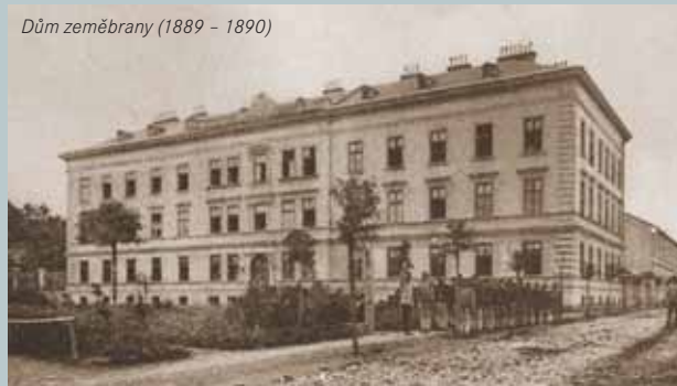
Dům zeměbrany (1889 – 1890)

Pocit z „města ve městě“ navozuje nejen rozlehlost areálu s vlastním kostelem a nemocnicí, ordinací zubaře, lékárnou, důstojnickým kasinem, ale u výčet místností budovy vyšší reálné školy, kde vedle ložnic a učeben najdeme i vlastní technická, přírodovědná a geograficko-historická muzea se stálými expozicemi nebo střelnici, šermířské, divadelní a jiné společenské sály. Už od roku 1918 budovy postupně chátraly. Časté změny funkce a vlastnictví armády zapříčinily, že z původního vybavení se téměř nic nedochovalo. Také fasády budov a především interiéry byly znehodnoceny účelovými úpravami nebo zcela zničeny.