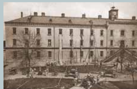
Ústavní hasičský oddíl před budovou Vyššího běhu

Elitní internátní vojenské školy zcela změnilý ráz Hranic. Město se stalo místem dlouhodobého pobytu synů z význačných šlechtických rodin a z rodin „horňích deseti tisíc“. Školy přinesly do ospalého venkovského města bouřlivou konjunkturu místní tovární i řemeslné výroby, přispěly k podstatnému snížení nezaměstnanosti a všestrannému rozvoji kulturního a společenského života. Vedly ovšem také k zostření národnostního napětí. Velitelský a pedagogický sbor škol i jejich rodinní příslušníci byli převážně německého původu. Posílili německou menšinu v honoraci města a při tehdejších nerovném volebním právu umožnili, aby německá menšina obyvatel ovládla městské zastupitelské orgány.