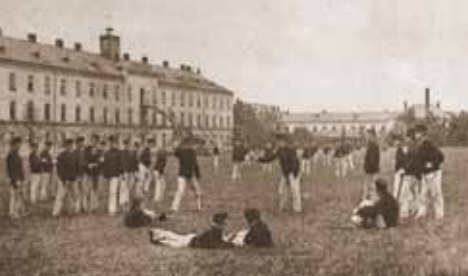
„Chovanci hrají na cvičišti metanou. V pozadí dům Vyššího běhu a plynárna. Fotografie od nadporučíka Karla Junga je z alba vydaného v roce 1893, krátce před příchodem studenta Roberta Musila.“

žily obranným cílům, byly z města postupně odstěhovány. V roce 1858 byla z Olomouce do Hranic přesunuta Dělostřelecká akademie. To samozřejmě vyžadovalo výstavbu dalších objektů a zařízení, nutných k výuce i praktickému výcviku budoucích důstojníků dělostřelectva.