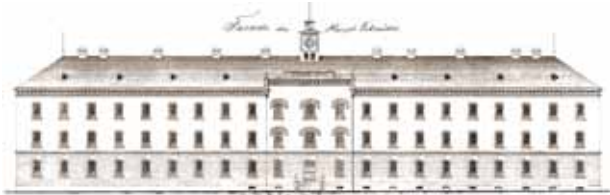
Budova Vyššího běhu

Mezi trojici hlavních budov byly vsazeny dva jednopatrové vedlejší domy. Podél dnešní ulice Čsl. armády tak vzniklo jednotné 538 metrů dlouhé průčelí a v interiéru téměř stejně tak dlouhá chodba, ale od začátku členěná do několika samostatných částí. Na fasádě střídme spojné budovy z roku 1862 vynikaly výraznými postranními rizality s nárožními fiálami a pěti sdruženými okny. Součástí traktu mezi kadetkou a budovou pro důstojníky byly také tři slavnostní sály, z nichž nejvýznamnější je bílo-zlatý novobarokní Zrcadlový sál .