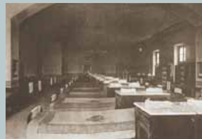
Ložnice chovanců Vyšší reálné školy

Reforma c. k. armády Revoluční události v letech 1848 – 1849 si v habsburské monarchii vynutily věnovat zvýšenou pozornost výchově budoucích vojenských profesionálů. Dosud byl velitelský sbor budován přežilým polofeudálním systémem prebend a privilegií. Reforma měla vytvořit pružný systém vzdělávání budoucích vojáků z povolání, který by umožnil vhodné uplatnění také chlapcům z rodin vojáků nižších hodností, sirotkům válečných veteránů a synům válečných invalidů. Internátní forma výuky měla chlapce ochránit před neustálými změnami služebních působišť jejich otců a formou kolektivní výchovy připravit na život vojenského profesionála.