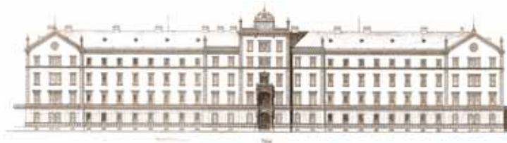
Dětlostřelecká akademie, později dům pro důstojníky (1860 – 1863)