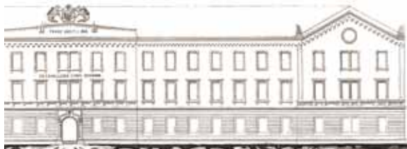
Průčelí jízdní kadetky

Negativní zkušenost s rakouským vojenstvím si nesl životem i další hranický chovanec, básník Rainer Maria Rilke , který strávil na vojenské reálce školní rok 1890 – 1891, než byl ze zdravotních důvodů propuštěn. Zmínku o zdejších vojenských školách najdeme i v nejnámějším románu dalšího německy píšícího spisovatele Josepha Rotha Radeckého pochod . Počátky Československé vojenské akademie v Hranicích jsou pak výrazně spjaty s básníkem Josefem Svatoplukem Macharem , tehdejším generálním inspektorem československé armády.