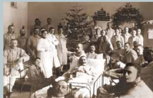
Vánoce v provi- zorní vojenské nemocnici v době působení Edith Steinové

školy. Jak vyplývá z jejich vzpomínek, traumatizující zážitky z utrpení raněných a nemocných ji přiměly po prvé důkladně uvažovat o smyslu života a staly se důležitým předstupněm její budoucí filozofické i teologické činnosti. V roce 1916 se stala žákyní Edmunda Husserla a později získala doktorát z filozofie. V roce 1922 konvertovala ke katolické církvi, nejprve vyučovala v klášterní škole ve Speyeru, později se stala docentkou v Münsteru. Po nástupu nacistů k moci se zřekla veřejného života, vstoupila do kláštera a přijala řeholní jméno Terezie Benedikta od Kříže. Na Silvestra 1938 ji přátelé tajně odvezli z Německa do Nizozemí na Karmel v Echtu. Tam žila až do svého zatčení 2. 8. 1942. Omitla nabídku osobní záchranu a dobrovolně následovala tragický osud ostatních Židů. Byla zavražděna v Osvětimi.