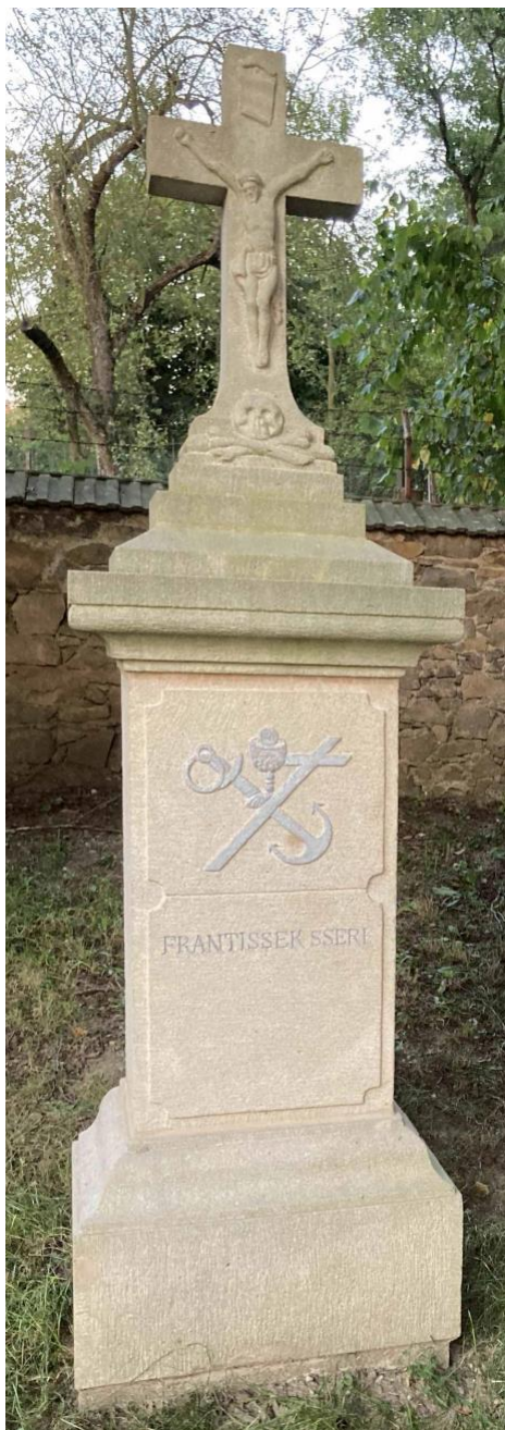
Obr. 7. Náhrobní kámen s nápísem FRANTISSEK SSERI.

Fotografie z 27. září 2023, zeměpisná šířka 49° 31' 8.358" N a délka 17° 55' 52.788" O