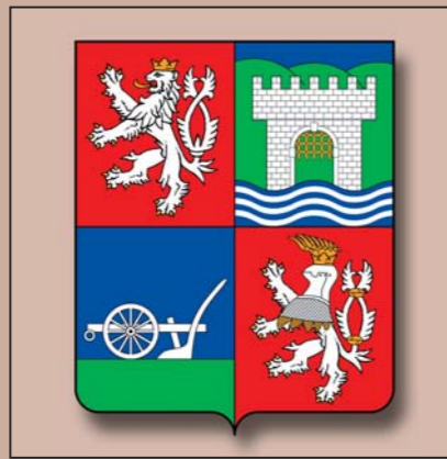
Armes actuelles de la Région d'Ústí. 2000.