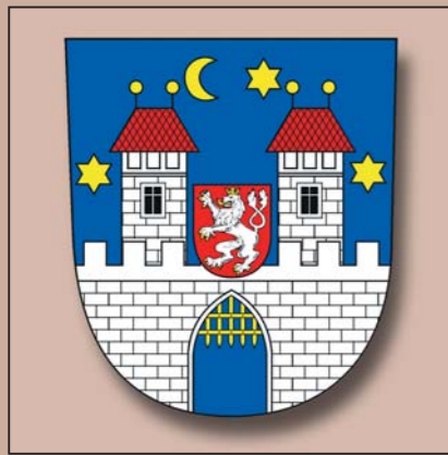
Armes actuelles de la ville de Písek, dans la Bohême du Sud. 2000.