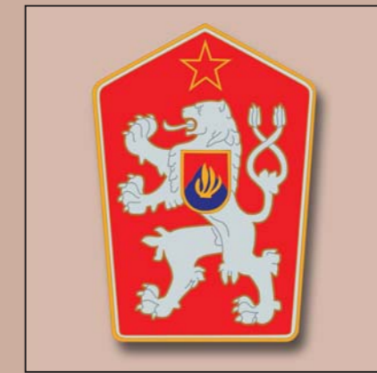
Une tentative de changer les règles de l'héraldique: armoiries de la République socialiste tchécoslovaque. 1960.