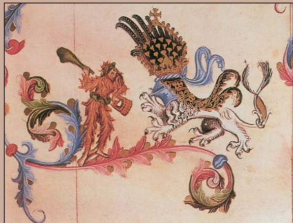
Lutte du sauvage avec le lion héraldique. Bible manuscrite du roi Václav IV (dite aussi Bible de Vienne, royale ou allemande), vers 1390.