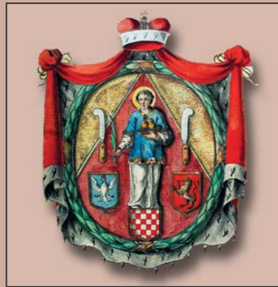
Armes de la ville morave de Hranice. 19 e siècle.

l'aigle couronnée, échiquetée rouge-argent, sur le fond bleu – apparaissent pour la première fois vers 1260.