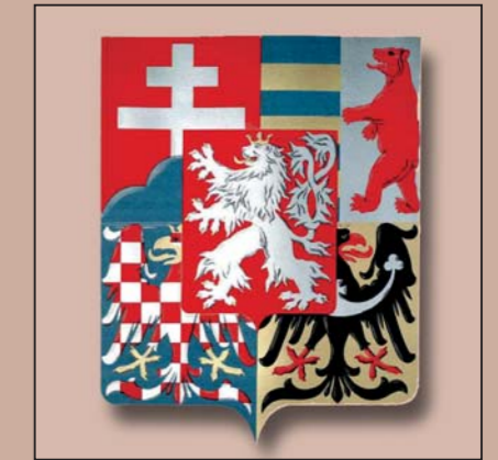
Armoiries moyennes de la République tchécoslovaque. 1920.