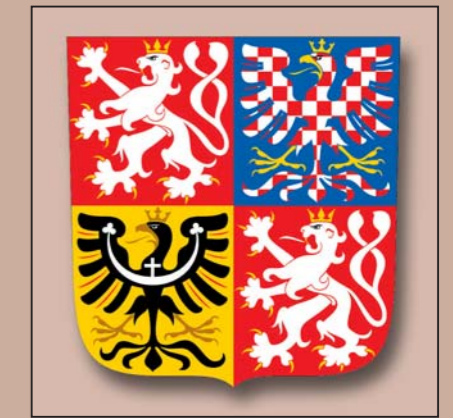
Armoiries actuelles de la République tchèque. Dessin de František Štorm.