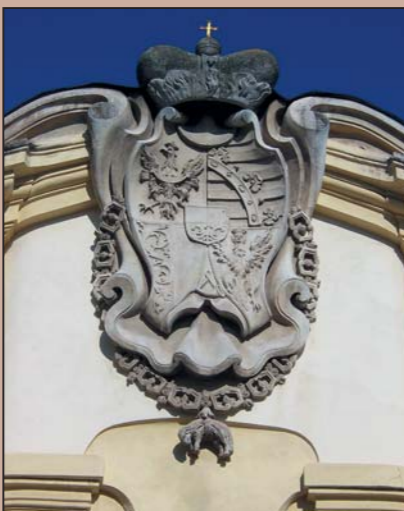
Armes de Charles de Liechtenstein, duc d'Opava. 1618.

monte, en outre, le nombre de personnes anoblies par le souverain. Les blasons de ces anoblis étaient meublés d'animaux et d'objets exotiques les plus divers devant symboliser l'activité ou le nom du nouveau noble.