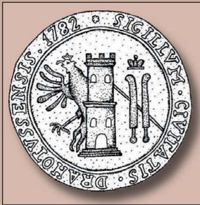
Dessin du sceau du bourg morave Drahotuše. 1782.