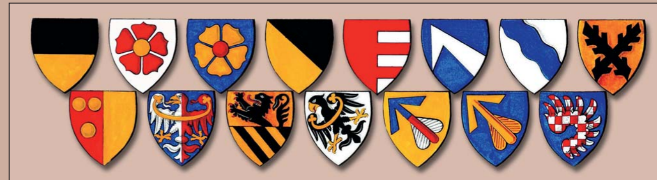
Blasons de la noblesse tchèque médiévale. Dessin de Petr Tybitancl.

milles avaient pour la plupart le titre princier. Inférieures étaient les familles de comtes suivies par celle de barons et de chevaliers.