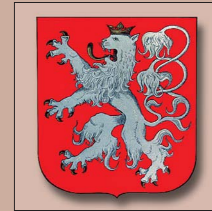
Armoiries provisoires de la République tchécoslovaque. 1918.

Depuis des siècles, les pays tchèques sont divisés en régions. Celles-ci n'avaient, toutefois, qu'une fonction administrative et leur population ne s'identifiait pas avec elles. La réforme d'administration de 2000 a créé en République tchèque 14 régions autonomes ayant leurs armes